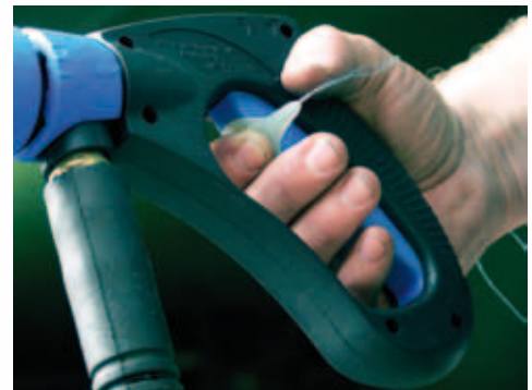
Abb.3. Produktergonomie - Messung der Bedienkräfte an Hochdruckreinigern

In den letzten 20 Monaten konnten die ergonomie.experten viele Projekte erfolgreich abschließen.