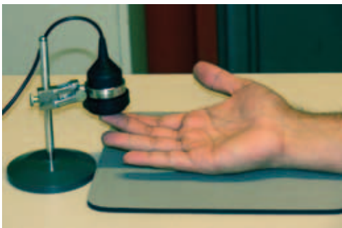
Abb.6. Ermittlung der Vibrationswahrnehmungsschwelle