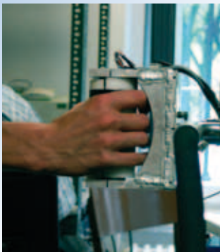
Abb.1. Hand-Arm-Schwingungsuntersuchung am Simulator

Die ergonomie.experten wurden mit dem Ziel gegründet, den kompletten Bereich der Ergonomie (bzw. der Arbeitswissenschaft) abzudecken und als die Ansprechpartner in Deutschland für alle Fragen der Ergonomie zu gelten.