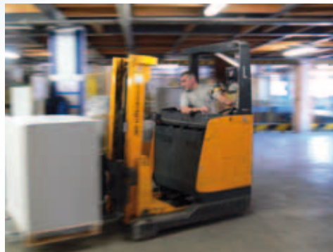
Abb.2. Ganzkörper-Schwingungsmessung an Flurförderfahrzeugen und Staplern